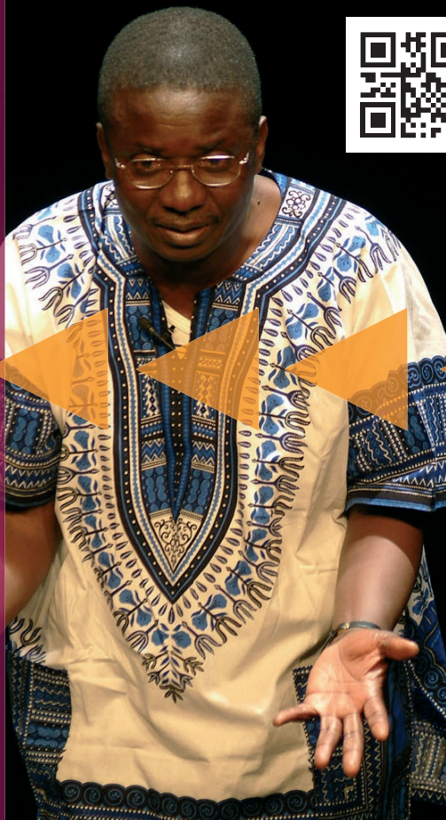
Le groupe Sangalayi