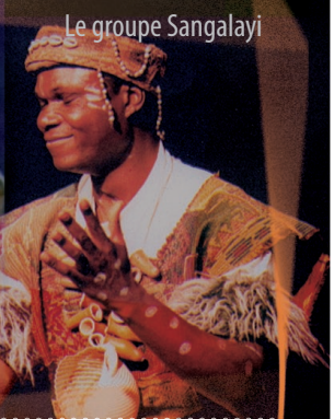
Le groupe Sangalayi